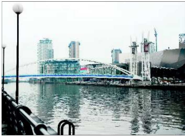
Die Salford Quays an der Grenze von Trafford und Salford: Rechts neben der hydraulischen Brücke ist das Kulturzentrum The Lowry.

Malerisch herausgeputzt ist Manchesters industrielles Erbe dagegen in Castlefield. Am Bahnhof Oxford Road steigen wir ein paar Stufen hinunter zum Bridgewater Kanal. Der dritte Duke of Bridgewater hat ihn Mitte des 18. Jahrhunderts bauen lassen. Dank des Kanalsystems erschloss sich Manchester eigene Transportwege zum Meer und war nicht mehr