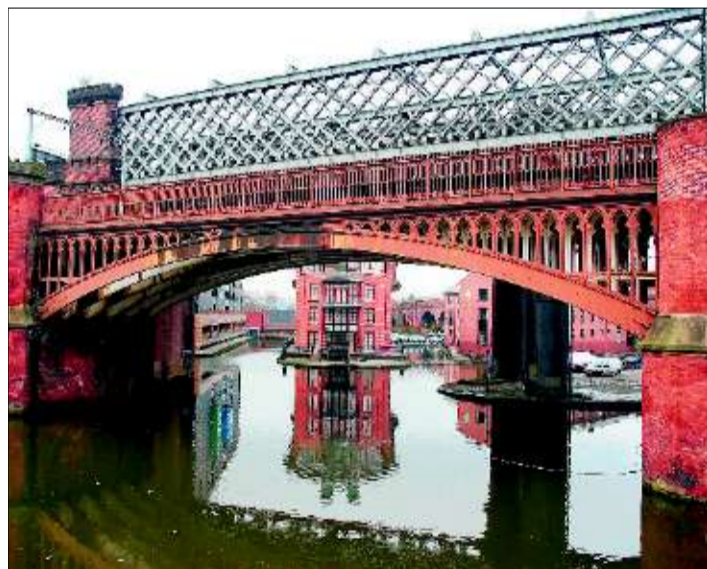
Schmuckes industrielles Erbe: In Castlefield sieht man Lagerhäuser aus rotem Backstein und alte Eisenbahnbrücken.

Ab Köln/Bonn fliegt Germanwings fünf Mal die Woche.