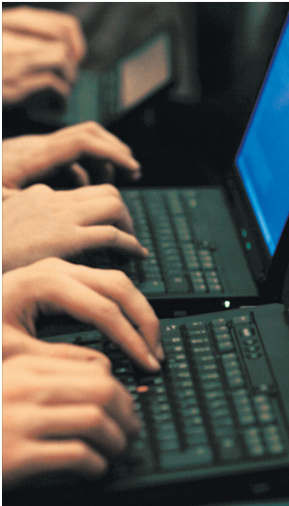
Computerexperten auf der Suche nach lückenhaften Firmennetzen