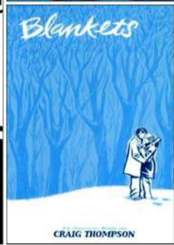
Anspruchsvolle Geschichten: „Autoroute du soleil“ von Baru, „Tagebuch einer Reise“ von Craig Thompson, „Persepolis“ von Marjane Satrapi, „Blau Pillen“ von Frederik Peeters (im Uhrzeigersinn) sind Beispiele für Graphic Novels.

den zu vertreiben, wegen der Berührungängste: „In Comicläden gehen bestimmte Leute einfach nicht rein.“ Und Comics im Buchladen können ja gut funktionieren – wie jüngst das Beispiel „Persepolis“ zeigt. Marjane Satrapi bei der Edition Moderne erschienene Erinnerungen an eine Kindheit und Jugend im Iran wurden zu einem viel gelobten Verkaufsschlager.