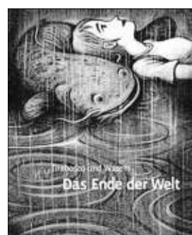
Das Geheimnis einer jungen Frau enthüllt „Das Ende der Welt“.

Ein Telefonanruf reißt die junge Frau aus ihrer Lethargie: Ihr Vater liegt nach einem