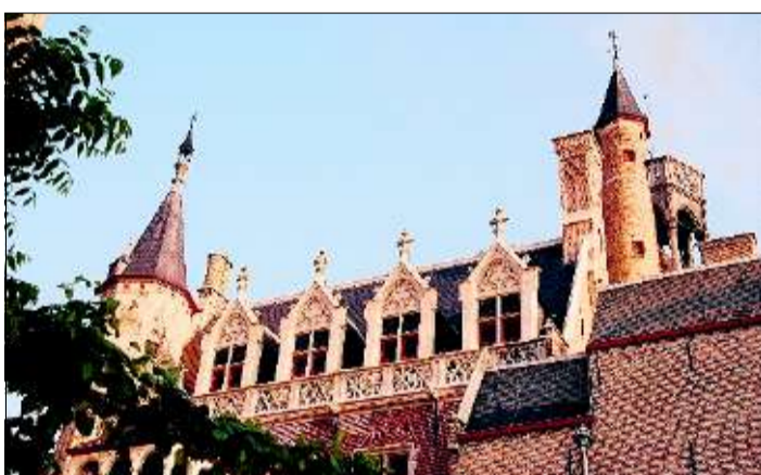
Die Liebfrauenkirche beherbergt Kunstwerke hinter ihren Backsteinmauern.