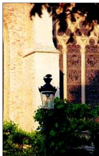
Ein früher Vogel in der Sonne, sonst ist morgens kaum einer da.

Aber 1482 starb Maria von Burgund nach einem Sturz vom Pferd – und mit den guten Zeiten war es vorbei. Witwer Maximilian von Österreich überwarf sich mit den Bewohnern Brügges. Denen, so geht eine Legende, platzte irgendwann der Kragen. Sie sperrten Maximilian in das Craenen-