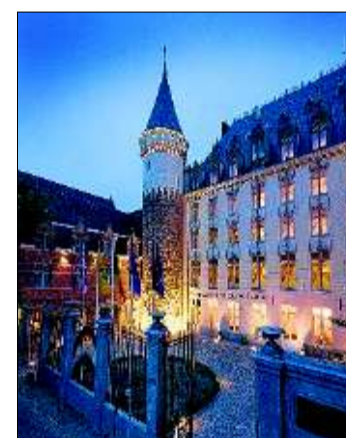
Einst Herzogsresidenz, heute ein nobles Hotel.