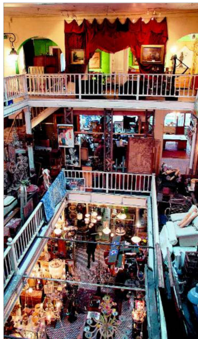
Kunst und Krepel in der Rue Blaes 125.

Anreise nach Brüssel mit dem Thalys oder der DB ab Köln Hbf, bis Bruxelles Midi. Informationen zu Unterkünften bei Belgien Tourismus Wallonie-Brüssel, www.belgien-tourismus.de .